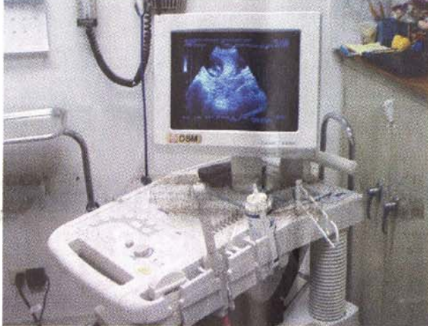
■ ULTRASOUND kini mendapat perhatian seluruh dunia kerana boleh mengetahui jantina dan penyakit dalam kandungan.