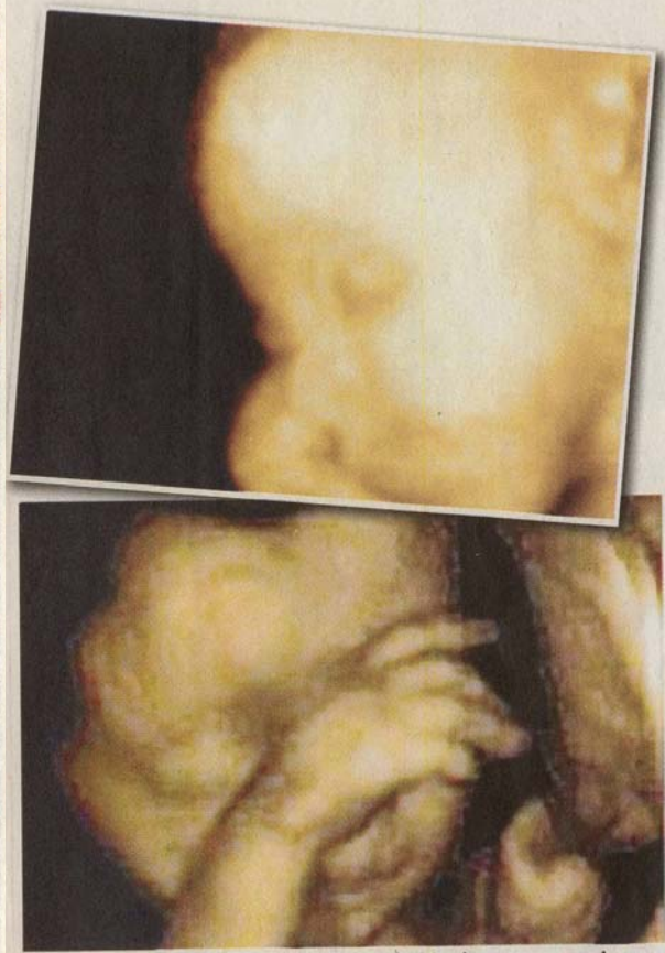
■ IMEJ janin dalam kandungan pada usia 28 minggu menerusi imbasan 3D.